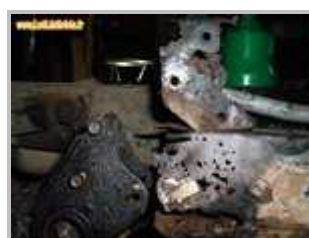
5 => Longérons arrière : corrosion perforante au niveau des fixations du train arrière (merci Foxclan pour la photo... et bon courage 😊)