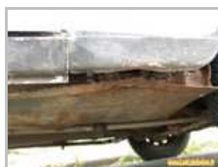
4 => Longérons avant : corrosion perforante au niveau des supports de cric (très courant)