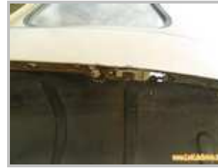
3 => ailes arrière : si on voit la corrosion à ce niveau c'est qu'elle s'est déjà bien développée à l'intérieur