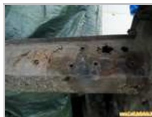
7 => Brancards arrière : corrosion perforante au niveau des fixations du train arrière (attention, ce n'est pas forcément visible facilement, ne pas hésiter à passer sous la voiture et tâter à la main)