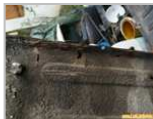
3 => Pare-boue : corrosion perforante