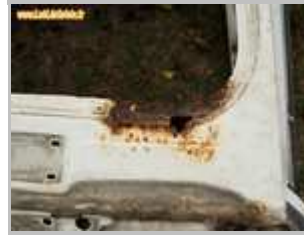
2-Contour de pare-brise : attention, le joint peut cacher la rouille