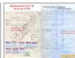
Emplacement du numéro de série sur la carte grise

Pour plus de détails, consulter l'article sur les plaques constructeur et numéro de série des Renault 4 .