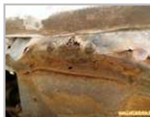
1 => traverse avant : corrosion du support de boite de vitesse