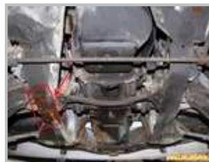
2 => Brancards avant : corrosion perforante