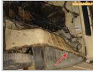
1=> Joue d'ailes avant : bien regarder les fixations du dessous qui sont souvent bien attachées