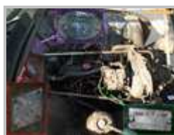
Emplacement des plaques constructeur