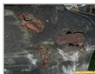
6 => plancher : corrosion perforante (voir même très très perforante 🤔)