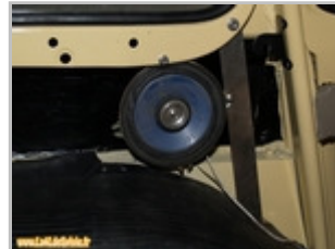
Enceinte fixée sur la 1ère plaque