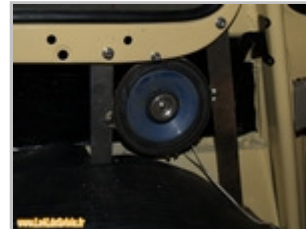
Pose de l'enceinte terminée